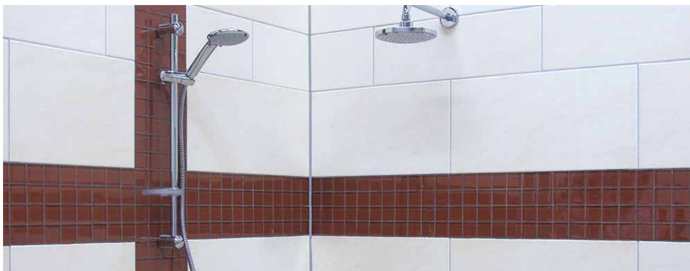
11 Joints colorés, brillants, dans la salle de bains.