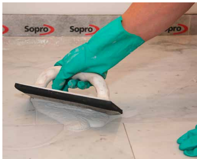
8 Application du Joint Déco Flex Sopro DF10® dans des pierres naturelles sensibles aux décolorations.