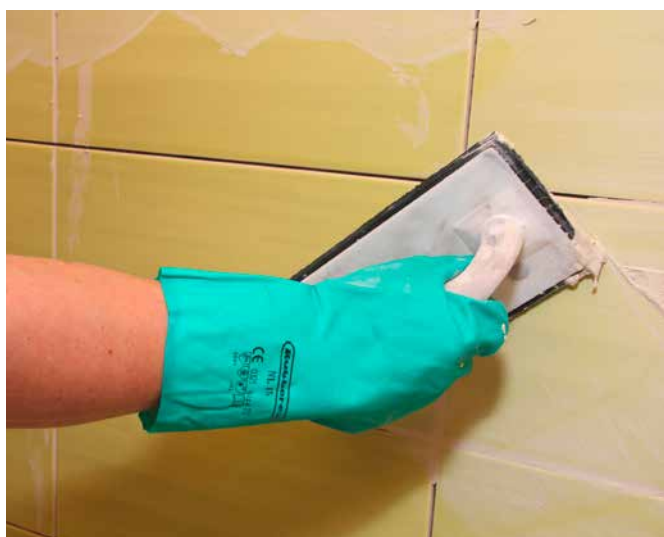
9 Application du Joint Sopro DF 10® sur les carreaux de faïence.