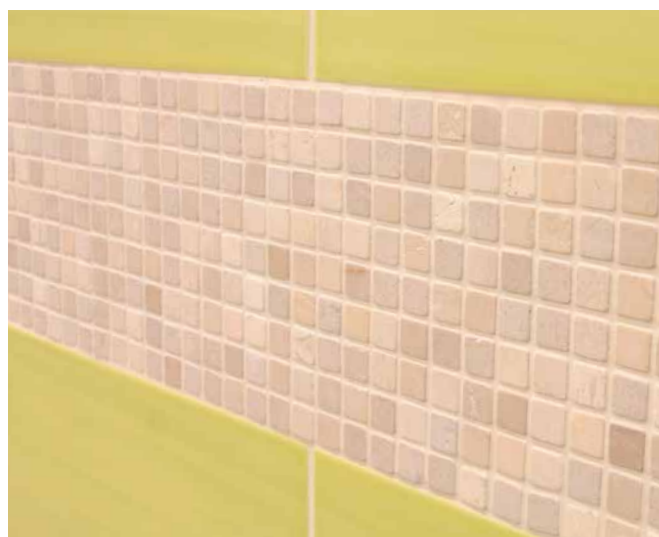
10 Surface de faïence/mosaïque de pierre naturelle jointoyée avec le Joint Déco Flex Sopro DF 10®.