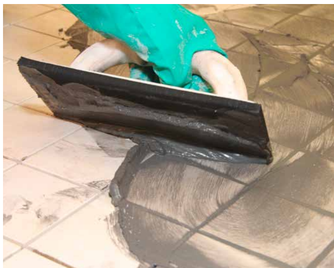
7 Application du Joint Sopro DF 10® sur les carreaux de grès pleinement vitrifiés.